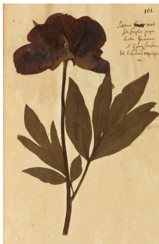
Piwonia czerwona z zielnika J.A. Helwinga.

Estetyka herbarium Helwinga to połączenie rabaty ogrodowej z łąką kwietną. Wstępny dobór roślin koncentruje się na okazach o właściwościach leczniczych, uprawianych w ogrodzie pastora. Wśród nich jest sasanka, nagietek oraz piwonia, uznawana za królową mazurskich ogrodów.