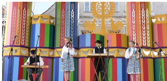
„Kapela z Elku” na kazimierskiej scenie.

Wszystkim nagrodzonym serdecznie gratulujemy, życząc dalszych sukcesów oraz wytrwałości w kultywowaniu muzycznych tradycji!