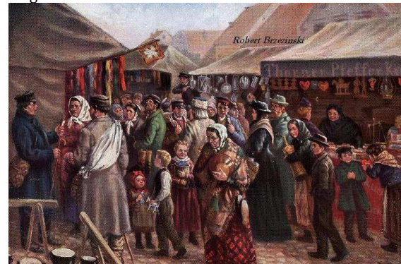
Mazurski jarmark w Szczytnie przed 1914 r.

Jarmarki odbywały się w ściśle określonych terminach, charakterystycznych dla poszczególnych miejscowości. Mogły trwać dzień, ale też i ponad tydzień. Jarmarki były charakterystyczne nie tylko dla miast. Urządzano je również w dużych wsiach kościelnych. Handlowano wieloma towarami, sprowadzanymi nieraz z bardzo odległych terenów. Podczas jarmarków odbywały się transakcje detaliczne, ale i hurtowe. Jarmarki mogły mieć charakter „ogólnohandlowy”, z różnym asortymentem, ale były też jarmarki „specjalistyczne”. Dla przykładu Welawa (obecnie Znamiensk w obwodzie kaliningradzkim) słynęła z dorocznych targów końskich.