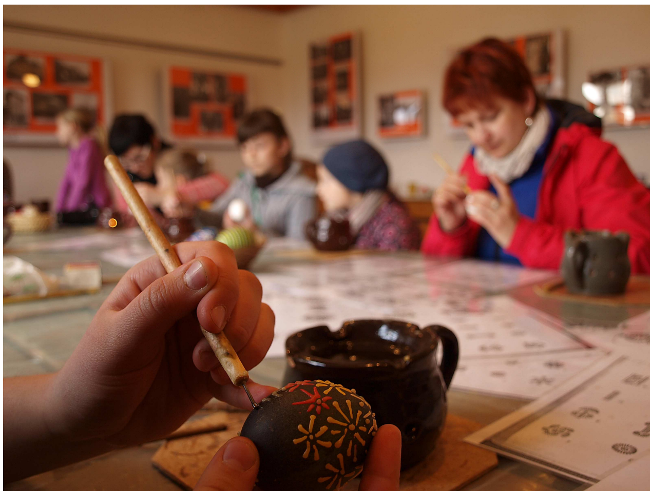
Każdy uczestnik „Święta Wiosny” za przysłowiowy grosz, pod fachowym okiem może zrobić własną pisanekę.

Na szczęście, we czwartek na gnieździe przy ul. Łuczańskiej zjawił się pierwszy węgorzewski bocian. Znak to niechybny, że przyszła prawdziwa wiosna! Tak więc, zapraszamy do świętowania.