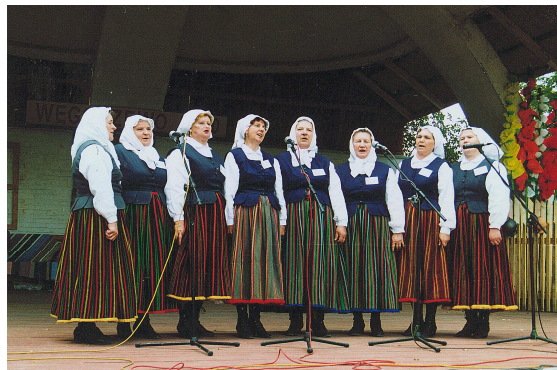
„Prząśniczki” podczas Jarmarku Folkloru w 2000 r.