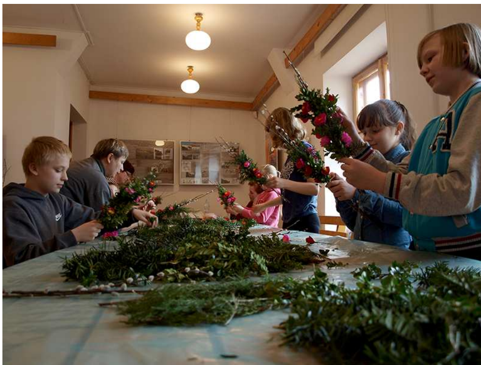
W Węgorzewie palmy wielkanocne potrafią zrobić także najmłodszy!

W tym roku bocianów nie trzeba już przywoływać, a cała przyroda budzi się już do życia. Można więc poświęcić się dobremu przygotowaniu do świąt Wielkanocy – i duchowemu, i materialnemu. Szczególnie w tym drugim zakresie pomogą węgorzewscy muzealnicy. Na straganach „Święta Wiosny” będzie można zaopatrzyć się w liczne rekwizyty świąteczne i przysmaki. Każdy, pod fachowym okiem, będzie mógł też zrobić, zgodnie z tradycją, własną pisanekę. Rozstrzygnięty zostanie także doroczny konkurs na gaik i marzankę. Zapraszamy!