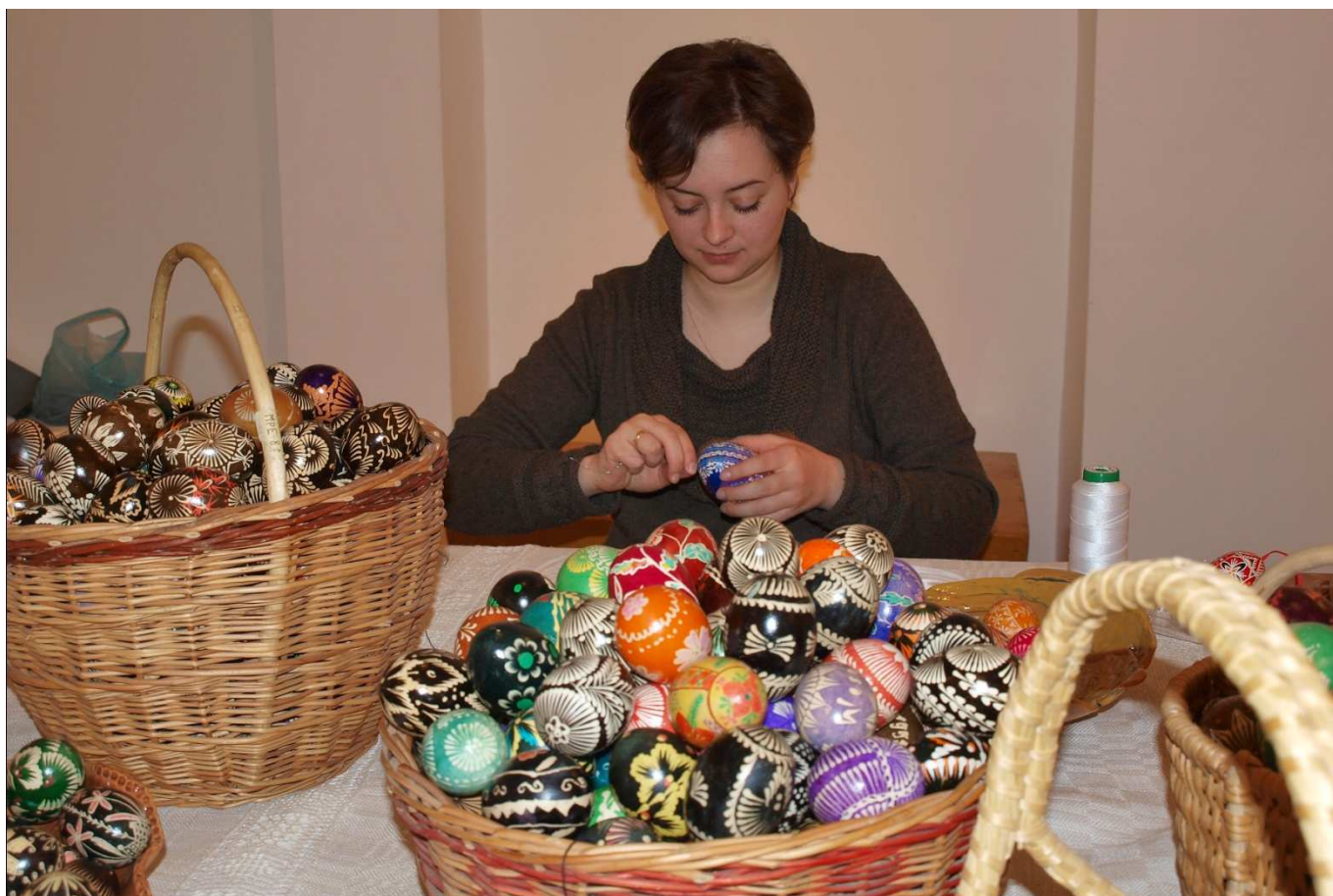
Przygotowania do nowej wielkanocno-wiosennej wystawy w Muzeum idą „pełną parą”.

Tegoroczne „Święto Wiosny” rozpocznie się 30 marca o godz. 10.00. Kiermaszowi sztuki ludowej i rękodzieła towarzyszyć będą występy grup folklorystycznych i pokazy rzemiosł tradycyjnych. O godz. 10.30 otwarta zostanie wystawa „Historie zapisane w pisankach...”, a o godz. 12.00 rozstrzygnięty zostanie konkurs na gaik i marzankę. Zapraszamy!