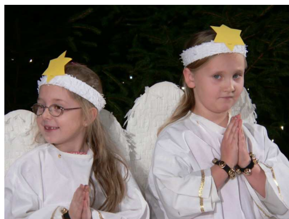
„Koguciki” jako aniołki AD 2008.