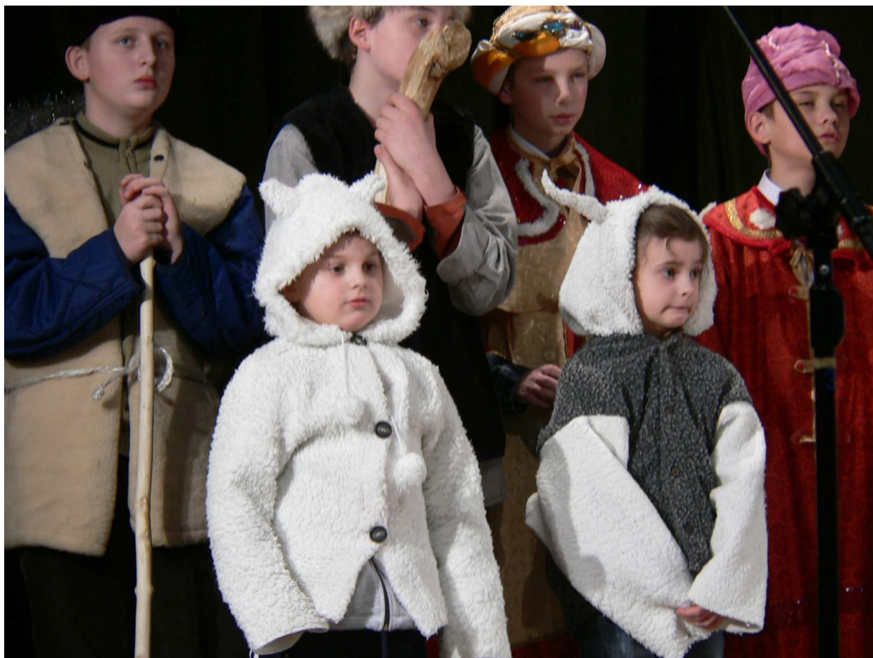
„Sobieszanie” z Sobiech podczas zeszłorocznego występu.

W gronie tegorocznych Herodów dość niespodziewanie znalazła się... grypa, która skutecznie uniemożliwiła udział w przeglądzie kilku grupom, zwłaszcza składającym się z najmłodszych artystów. Żal wielki, ale zdrowie najważniejsze! Tych, których jednak gorączka i inne dolegliwości nie dopadły, zaprezentują się 29 i 30 stycznia na scenie Węgorzewskiego Centrum Kultury. W XXVII Międzynarodowym Przeglądzie Widowisk Kolędniczych „Herody 2009” udział weźmie 25 zespołów: z Litwy, Rosji i Polski. Organizację tegorocznej edycji wspiera niezawodny Związek Gmin Warmińsko-Mazurskich w Olsztynie. Wielkie dzięki!