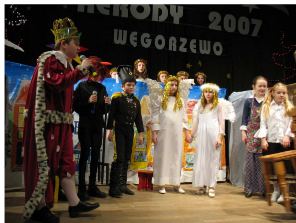
Zespół „Krasnale” z Windy w ubiegłorocznym przedstawieniu.

Kolędników przebranych za Króla Heroda, śmierć, diabła, strażnika, anioła oraz gospodynie wiejskie będzie można zobaczyć w spektaklu „Chodzenie z gwiazdą”. Przedstawienie oparte na tradycji rodem z Podlasia.