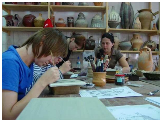
Warsztaty kaflarskie.

Właśnie przed kilku dniami zakończyły się warsztaty ceramiczne, w których udział wzięła młodzież akademicka. Młodzi adepci toczenia garnków i wylepiania kaflów odtwarzali wzory, a także eksperymentowali z naśladownictwami zabytków sprzed wieków. Część z nich została pozyskana wiosną we wsi Pieczarki, gdzie badano wykopaliskowo relikty założenia mieszkalnego młynarza Łazarza z XVI w. W muzealnym skansenie stanął także piec do wypalania ceramiki.