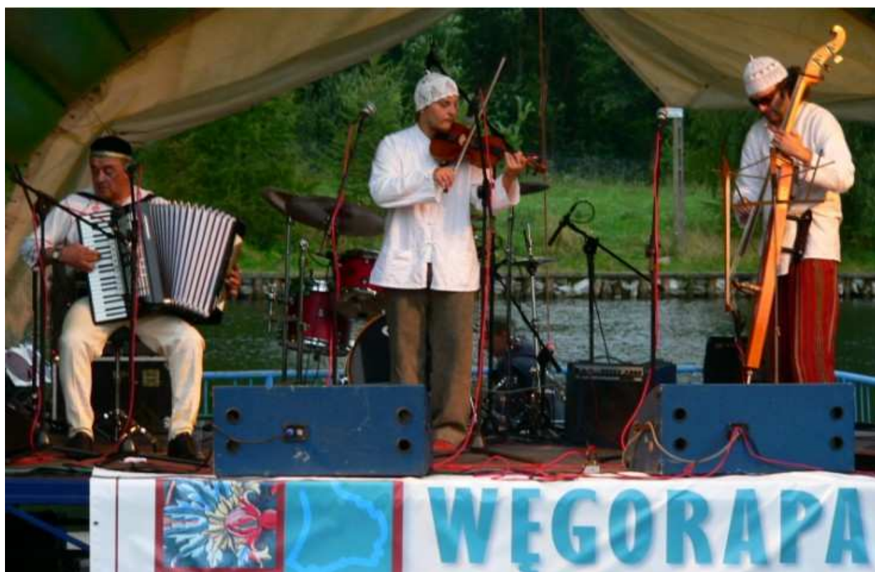
„Krzywa Grzywa” podczas zeszłorocznej edycji Węgorapa Folk Music Festival.