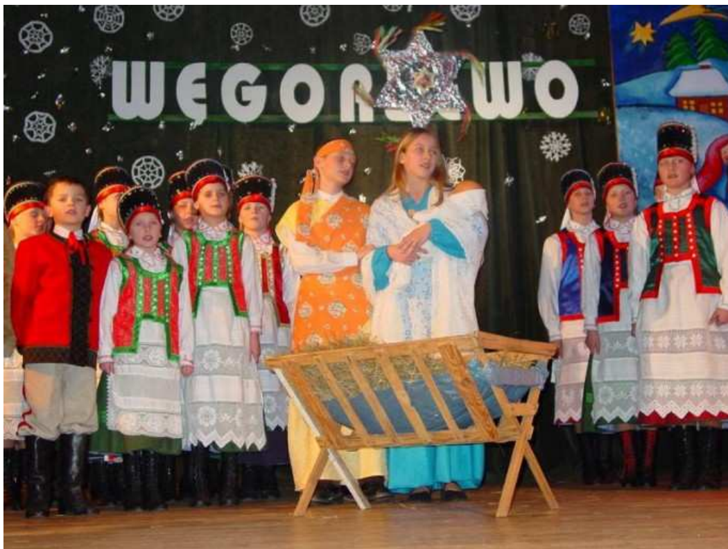
Zespół „Młode Kurpie” z Jednorożca.

Tegoroczne „Herody” trwają trzy dni. We środę, 25 stycznia Muzeum Kultury Ludowej gości uczestników konferencji „Tradycyjna obrzędowość okresu bożonarodzeniowego”. W tym przedsięwzięciu ujętym w cykl „Kultury Pogranicza”, zaprezentują się wykładowcy z Litwy, Rosji, Ukrainy i Polski. Natomiast czwartek i piątek to przegląd widowisk kolędniczych, na który zgłosiło się czterdzieści zespołów z Polski i zza granicy. Na scenie Węgorzewskiego Centrum Kultury i Promocji zobaczyć można różnego typu przedstawienia i widowiska nawiązujące do narodzin Pana Jezusa.