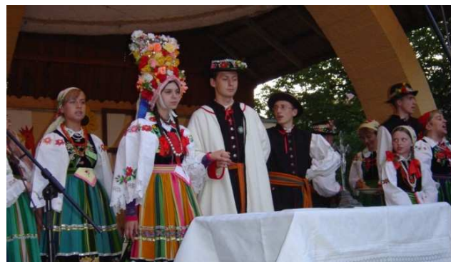
Kapela ludowa „Tkacze”

„Sużanianka” istnieje od 1987 r. W swoim repertuarze ma piosenki ludowe z okolic Sużan. Koncertował w całej Polsce oraz reprezentował folklor wileński na Ogólnopolskim Festiwalu Kapel i Śpiewaków Ludowych w Kazimierzu Dolnym nad Wisłą.