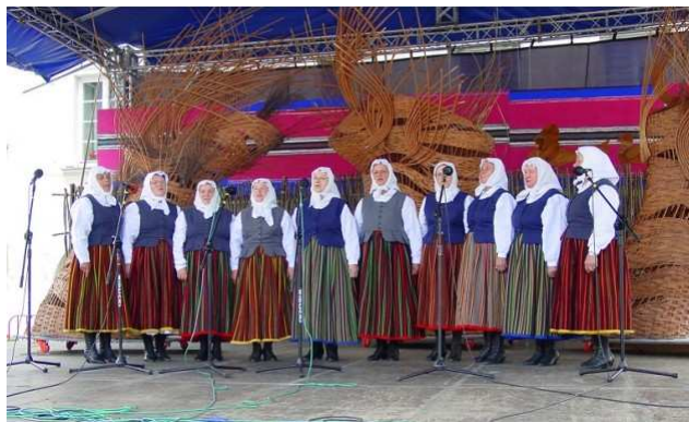
„Prząśniczki” na kazimierzowskiej scenie.

W sumie w tegorocznym konkursie XXXIX Ogólnopolskiego Festiwalu Kapel i Śpiewaków Ludowych w Kazimierzu Dolnym, który odbywał się w dniach 24-26 czerwca 2005 r., wzięło udział: 30 zespołów śpiewaczych, 22 kapele ludowe, 13 instrumentalistów, 26 solistów śpiewaków oraz 24 grupy wykonawców w konkursie „Duży-Mały”. Łącznie wystąpiło ok. 800 artystów ludowych reprezentujących 12 województw.