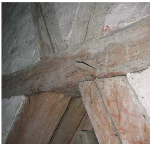
Solidne konstrukcje drewniane kościoła w Węgielsztynie.

Dęby, z których zostały zbudowane konstrukcje w kościele św. św. Piotra i Pawła w Węgorzewie zostały ścięte w okresie od po 1531 r. do po 1596 r., co zgodne jest z danymi historycznymi mówiącymi, iż budowa świątyni trwała od 1605 r. do 1611 r. Elementy konstrukcyjne z sosny wydatowano od po 1682 r. do po 1836 r., w tym kilka prób pochodziło z tego samego 1728 r. To daty kolejnych remontów i przebudów węgoborskiego kościoła – wówczas o dębinę było już dużo trudniej, niż jeszcze na przełomie XVI i XVII w.?