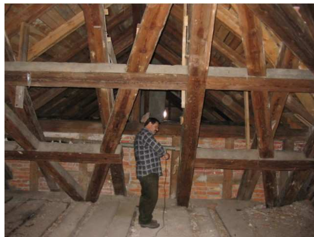
Konstrukcja głównej bryły sztyńortkiego pałacu jest jednorodna i jednoczasowa.

Sosny ścinano tutaj w latach 1687, 1688 i 1689 r., co również potwierdziło dane historyków.