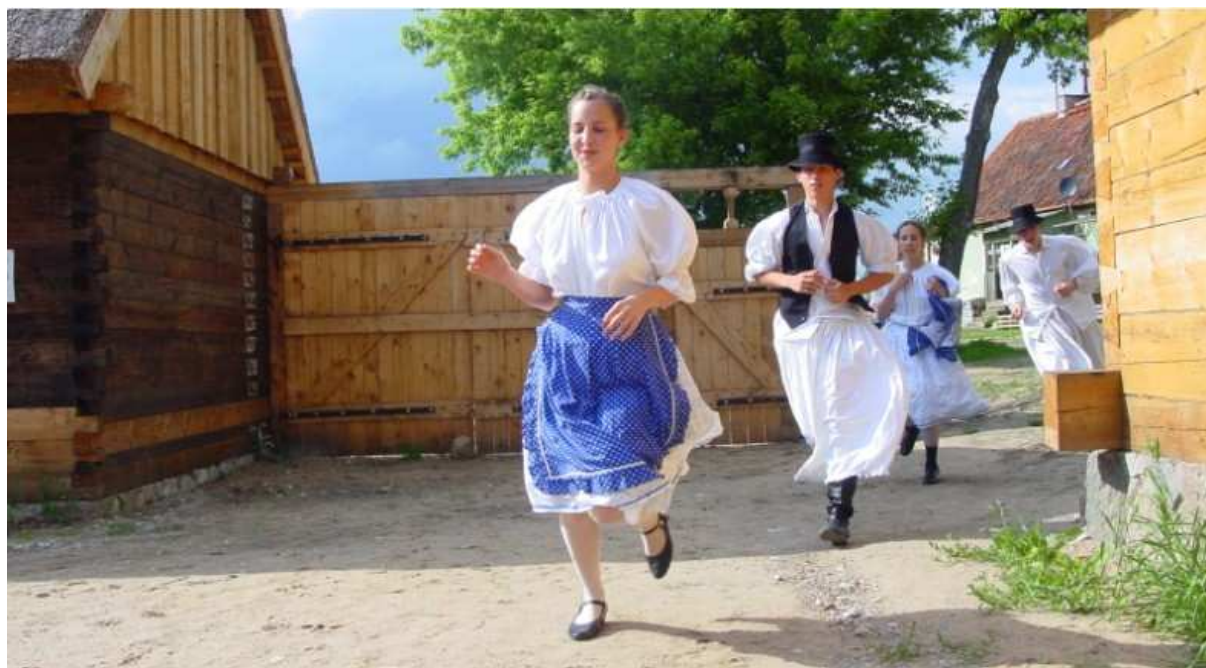
Biegiem na węgorzewski Jarmark!

Sierpień na Mazurach nie może się obejść bez węgorzewskiego Międzynarodowego Jarmarku Folkloru. W tym roku swoje występy zapowiedziały 54 zespoły, kapele oraz soliści. Najlepsi, wybrani przez jury, z województwa warmińsko – mazurskiego będą reprezentować nasze województwo na przyszłorocznym Festiwalu w Kazimierzu Dolnym nad Wisłą. Ja co roku, tak i teraz nie może zabraknąć też gości z zagranicy, z Litwy, Białorusi, Ukrainy, Rosji, Łotwy, Niemiec. Węgorzewski Jarmark będzie okazją m. in. do bezpośredniego zetknięcia się z mało znanym w Polsce folklorem Serbołużyczan oraz Gruzinów. Na straganach swoje wyroby rozłoży ponad 150 rękodzielników – będzie się o co targować!