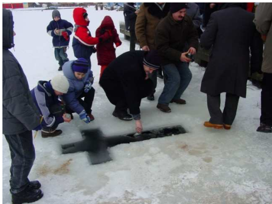
Święto Jordanu 2004 r.

19 stycznia wierni obrządku greko - katolickiego oraz prawosławni obchodzą święto Jordanu (Bohojawlenia, Wodochreszcza). To pamiątka chrztu Jezusa w rzece Jordan.