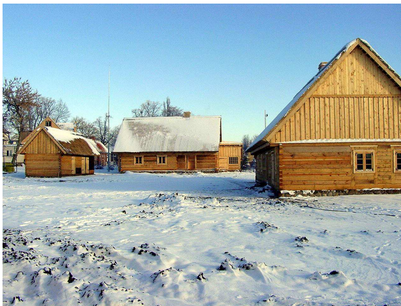
Nowe obiekty w węgorskim skansenie.