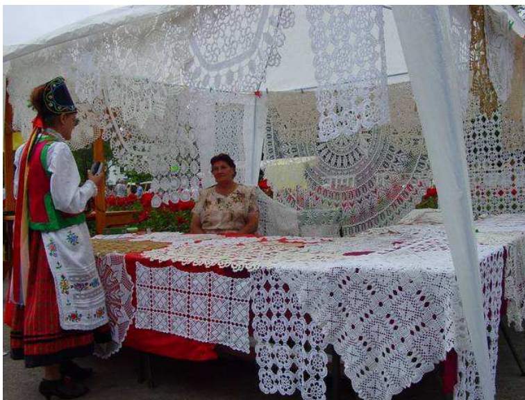
Koronek ci u nas dostatek. Jarmark Folkloru 2001 r.

Węgorzewo rozbrzmiewać będzie muzyką kapel ludowych, zespołów, głosami śpiewaków. Jak w roku ubiegłym swój talent śpiewaczy, taneczny, muzyczny zaprezentują 55 wykonawców z Polski (m. in. laureaci tegorocznego festiwalu w Kazimierzu Dolnym nad Wisłą) oraz państw ościennych Litwy, Łotwy, Rosji, Białorusi, Ukrainy, Czech. W przeglądzie wezmą udział 32 zespoły ludowe z województwa warmińsko - mazurskiego, wyróżniające się uzyskują promocje na Ogólnopolski Festiwal Kapel i Śpiewaków Ludowych w Kazimierzu nad Wisłą w roku 2003 r. I po raz trzeci zostaną przyznane honorowe nagrody Jarmarku „Złote Jelonki” - za szczególną troskę w pielęgnowaniu rodzimej tradycji.