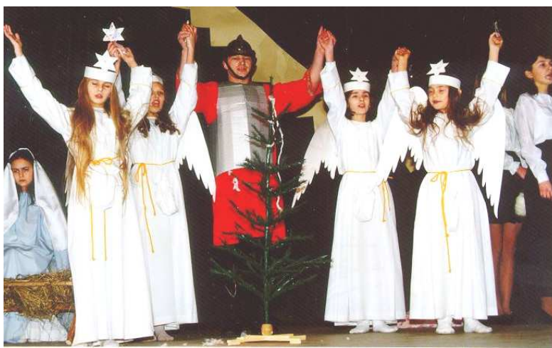
Tak jak w latach ubiegłych, tak i w tym roku z pewnością na węgorzewską scenę spłyną anioły.