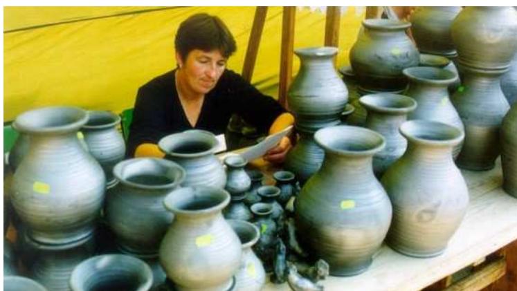
Garniki to tylko jedna z kategorii wyrobów rękodzielniczych, które można kupić na węgorszewskim Jarmarku. Tak było w roku ubiegłym.

Spis organizatorów drugiej edycji – pierwszej numerowanej, był już bardziej okazały. Obok MGOK w Węgorzewie, wystąpił Wydział Kultury i Sztuki Urzędu Wojewódzkiego oraz Wojewódzki Dom Kultury w Suwałkach. Później do organizacji przyłączył się suwalski oddział Stowarzyszenia Twórców Ludowych oraz Wojewódzki Związek Kółek i Organizacji Rolniczych w Suwałkach.