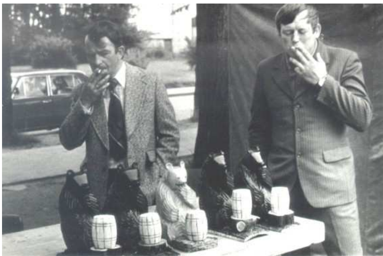
Pięć miśków z beczkami miodu i ich właściciele. Przełom lat 70-tych i 80-tych.