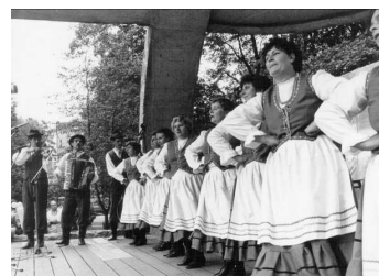
Generalnie to panie tańcza, a panowie grają. Jarmark 1989 r.