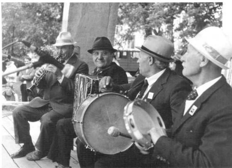
Wojewódzki Jarmark Folkloru 1989.